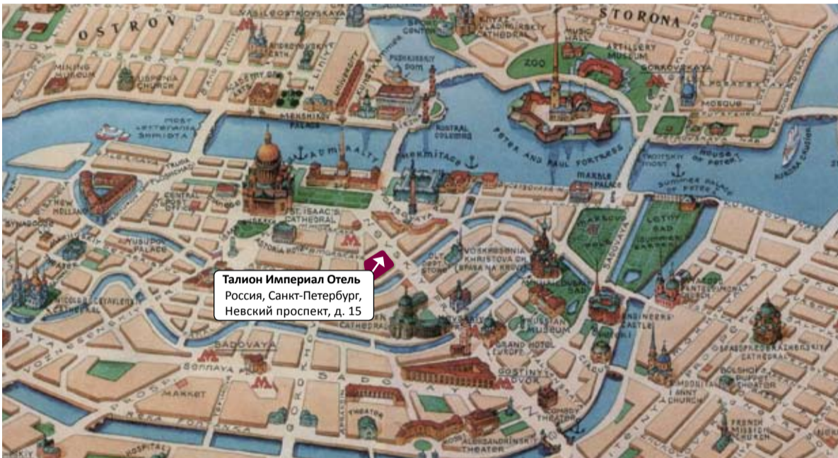
Талион Империл Отель Россия, Санкт-Петербург, Невский проспект, д. 15